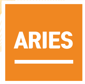
아리아스 (조작이 쉬운 프로그램탑재)